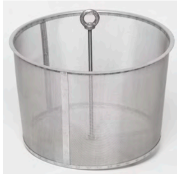
Abb.3: Filter beim Reinigen mit einer Spritzpistole