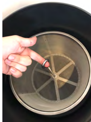
Abb. 4: Entnahme des Filterkorbes aus dem Gehäuse