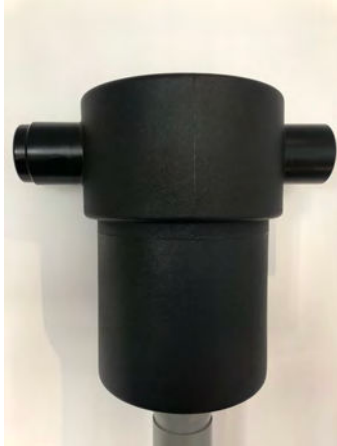
Abb.1: Filter komplett

Durch die angebrachte Entnahmeöse lässt sich dieser einfach und schnell zur Wartung entnehmen.