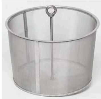
Abb.3: Filter beim Reinigen mit einer Spritzpistole