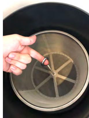
Abb. 4: Entnahme des Filterkorbes aus dem Gehäuse